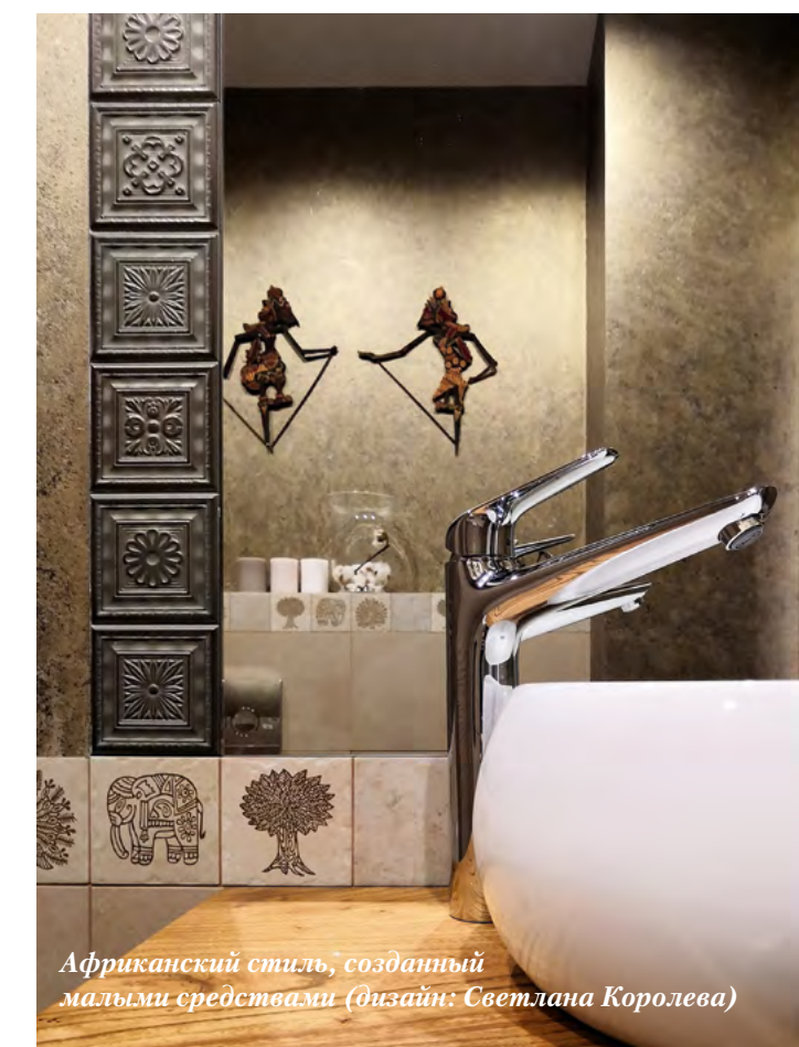
Африканский стиль, созданный малыши средствами (дизайн: Светлана Королева)

Все они несут на себе черты рукотворности, словно сошли не с современной линии, а появились из-под руки мастера, искусно придавшего форму и расписавшего каждый отдельный фрагмент. Красочная майолика, затейливые узоры в стиле мудахар, геометрические мавританские орнаменты добавляют в интерьер ритмику контрастных сочетаний и живой испанский колорит. Не забыты и поклонники других стилей. Восприимчивость неоклассического мрамора, цветной бетон в модном формате шестиугольника — все это краски для воплощения интересных задумок, которые можно использовать отдельно или в сочетании с другими элементами.