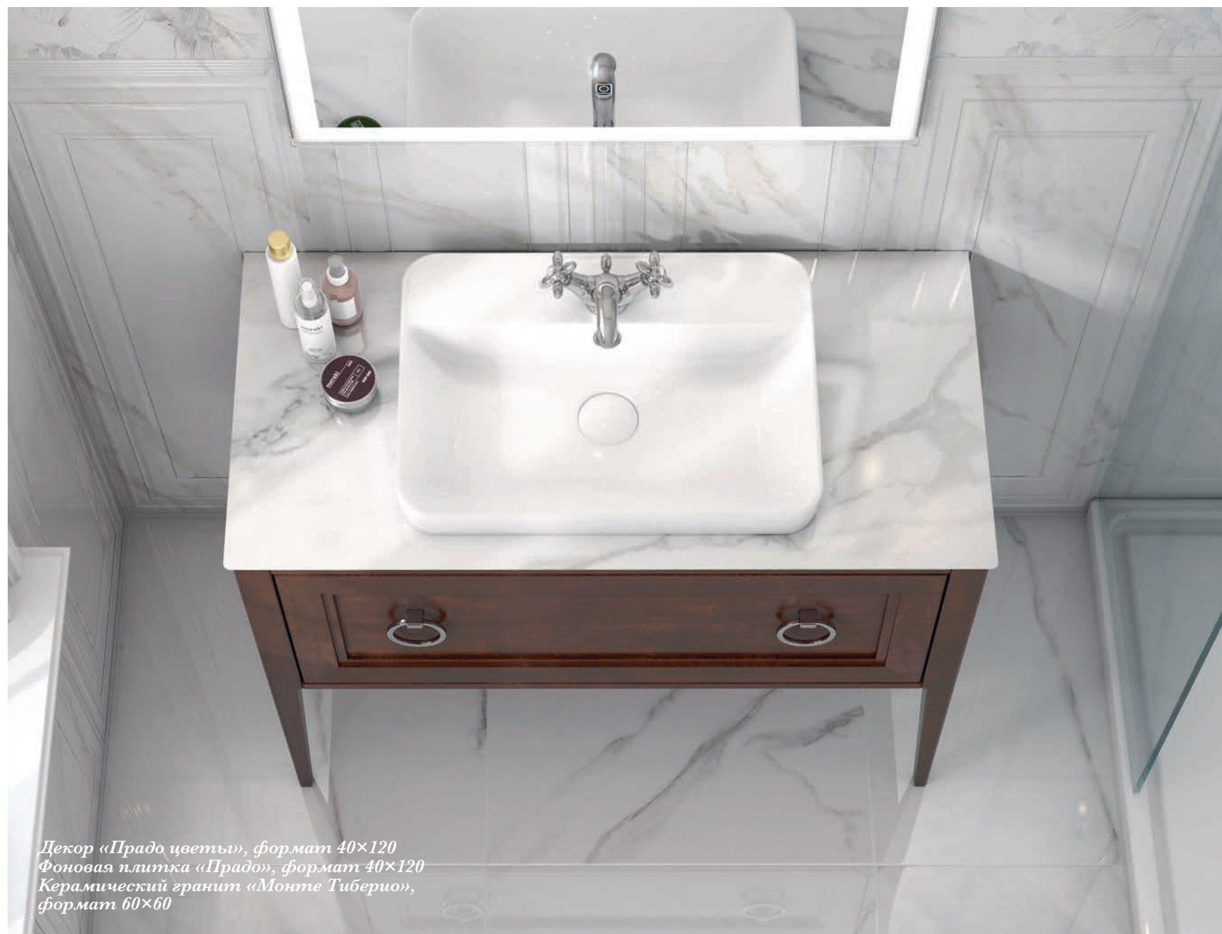
Декор «Прадо цветы», формат 40×120 Фоновая плитка «Прадо», формат 40×120 Керамический гранит «Монте Тиберио», формат 60×60

Чтобы оживить дизайн ванной, в композицию можно добавить неоклассические декоры «Сибелес» — орнамент, напоминающий перламутровую инкрустацию. Фоном для геометрического рисунка служит воспроизведение мрамора «Калакатта».