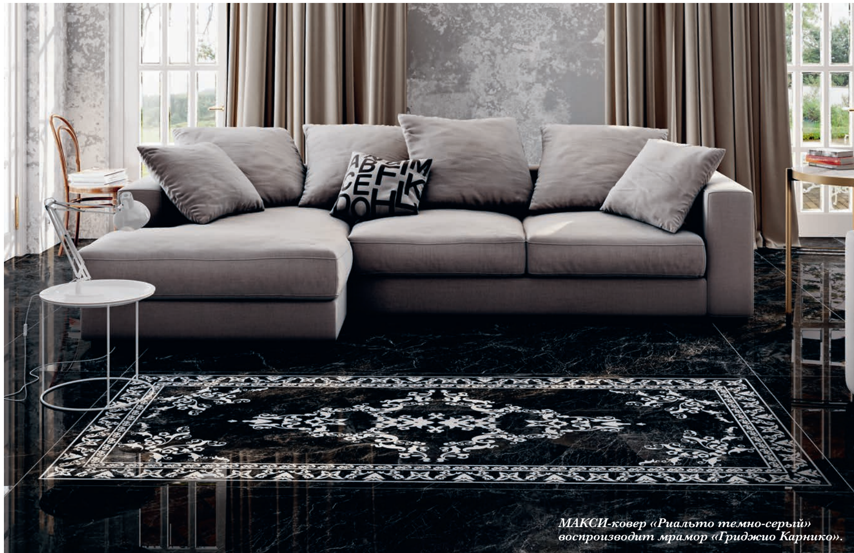
МАКСИ-ковер «Риальто темно-серый» воспроизводит мрамор «Гриджю Карнико».