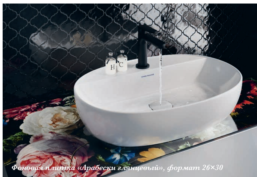
Фоновая плитка «Арабески глянцевый», формат 26×30