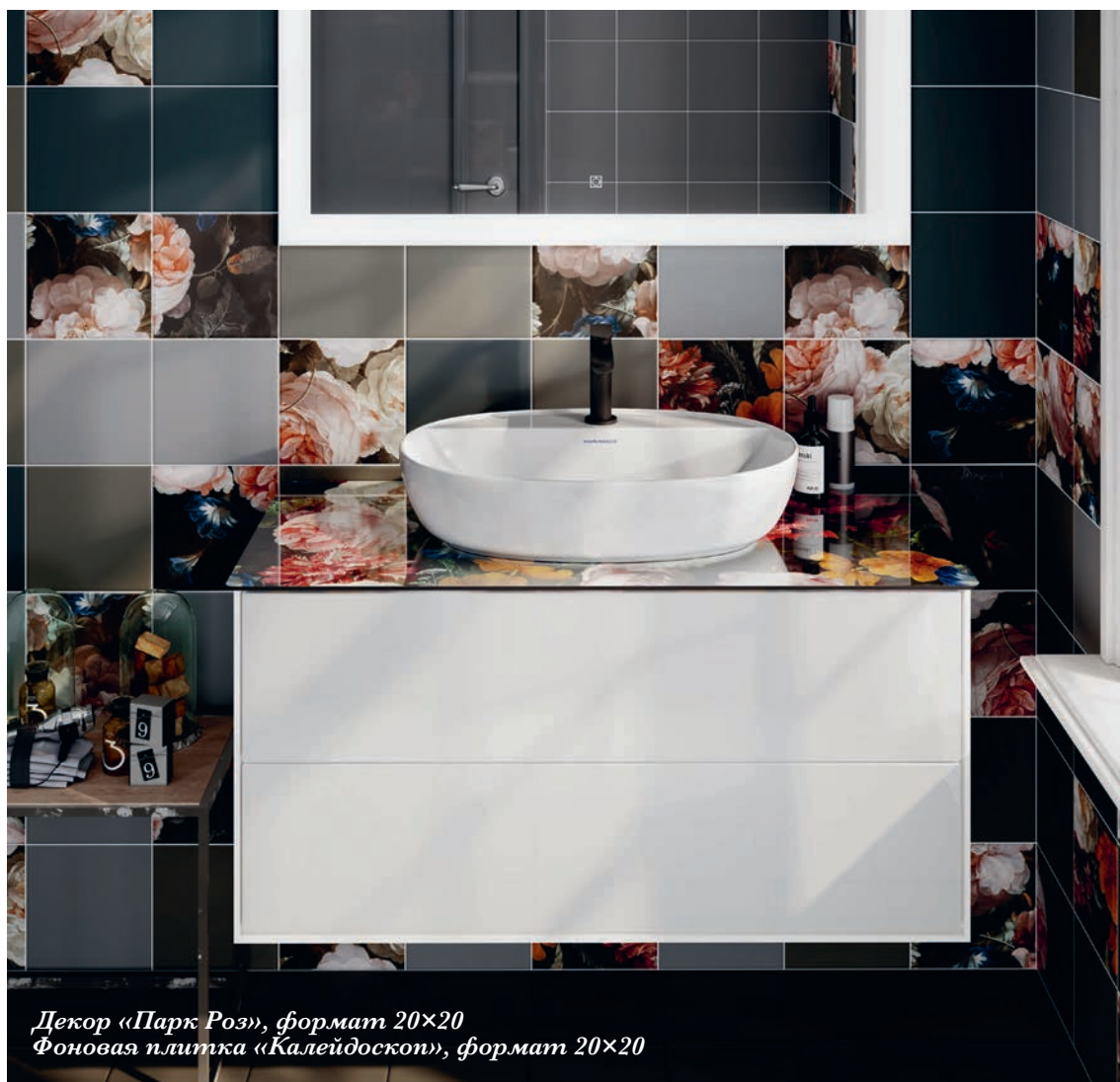
Декор «Парк Роз», формат 20×20 Фоновая плитка «Калейдоскоп», формат 20×20

Накладная раковина PLAZA, ширина 60 см Тумба PLAZA Modern, ширина 100 см Столешница «Парк Роз», ширина 100 см