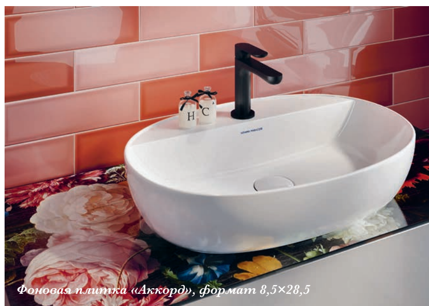
Фоновая плитка «Аккорд», формат 8,5×28,5