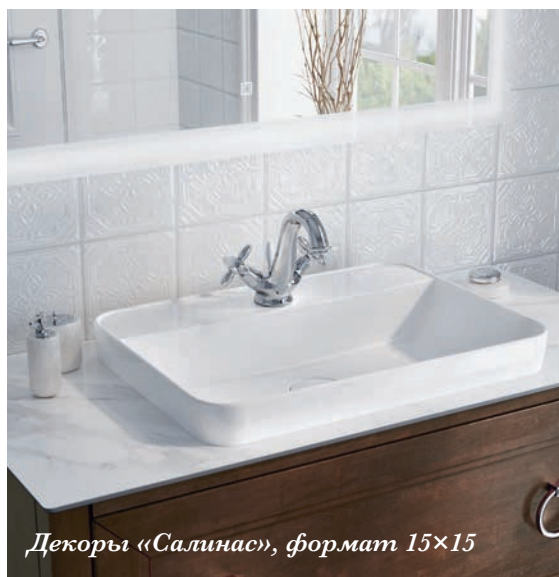
Декоры «Салинас», формат 15×15

Столешница «Монте Тиберио», ширина 100 см