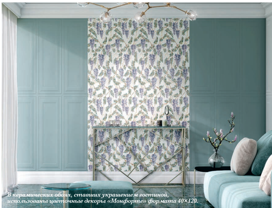
В керамических обоях, ставших украшением гостиной, использованы цветочные декоры «Монфорте» формата 40×120.

Из декоративных элементов на полу можно составить керамический ковер практически любого размера. Такие «ковры» с равным успехом используются в современных и классических интерьерах; они словно вводят новое измерение индивидуальности для гостиной, столовой и других жилых зон. Кроме наборных ковров в каталоге решений KERAMA MARAZZI есть и ковры МАКСИ-формата. Впечатляющие своим размером плитки из керамического гранита можно назвать самыми крупными декоративными элементами. При этом используют их во всех интерьерных «измерениях», делая обстановку еще более неповторимой.