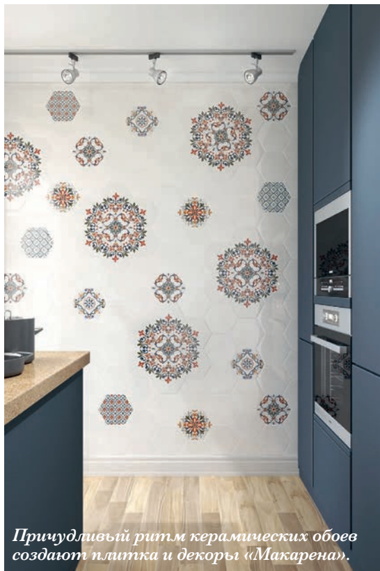
Причудливый ритм керамических обоев создают плитка и декоры «Макарена».