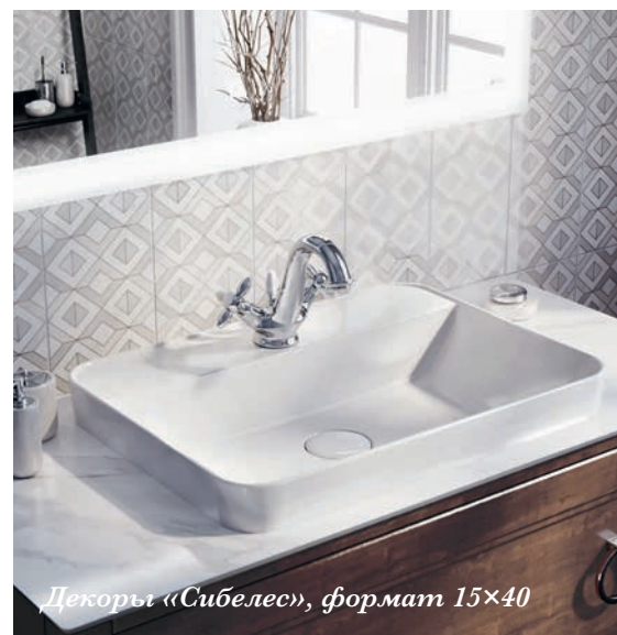
Декоры «Сибелес», формат 15×40

Границы классического стиля в данном случае расширяем с помощью оригинальных мини-форматов «Салинас». Орнаментальные декоры в светло-бежевом цвете, напоминающие изразцы ручной работы, отлично сочетаются с мраморной столешницей.