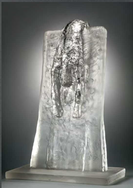
↑ Илья и Эмилия Кабаковы «Памятник вечному эмигранту» (2013)

Стеклянные платья, задрاپированные вокруг отсутствующих тел, — обнажённая натура наоборот. Чтобы добиться наибольшей пластичности, американская художница сначала создаёт платья из ткани, а затем мастера студии Venengo отливают их из тёмного стекла.