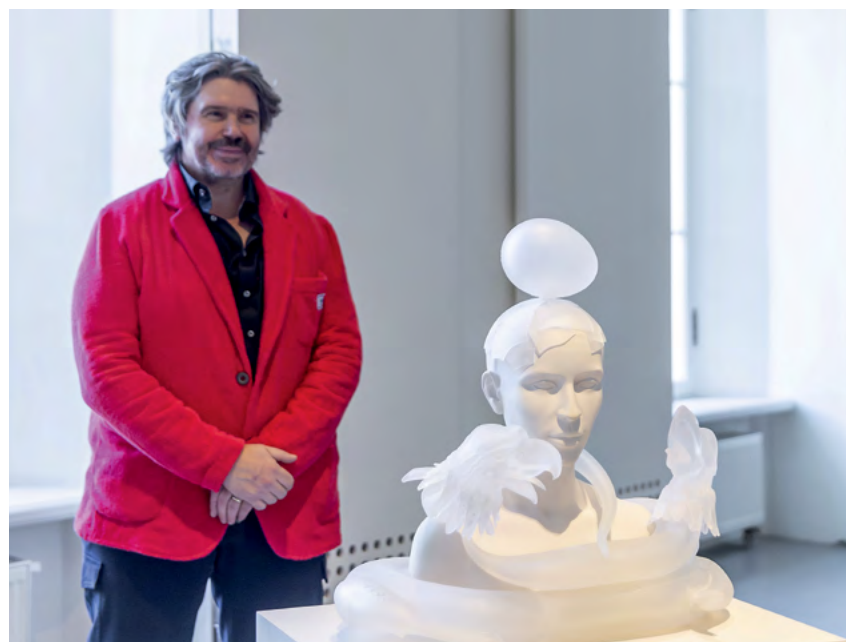
Бельгийский художник Кун Ванмехелен и его работа «Искушение». Помимо стекла, автор увлечен генетикой и во многих арт-проектах использует образ куриного яйца.

KERAMA MARAZZI гордится тем, что поддерживает инициативы, способные вдохнуть новые смыслы в хорошо знакомые и применяемые повсеместно материалы. Ежегодно компания производит 52 000 тонн стекла в виде глазури и других покрытий для нанесения на поверхность своих продуктов. Впереди — Международный год стекла: уверены, что он даст ещё немало поводов поговорить об этом удивительном материале вне времени.