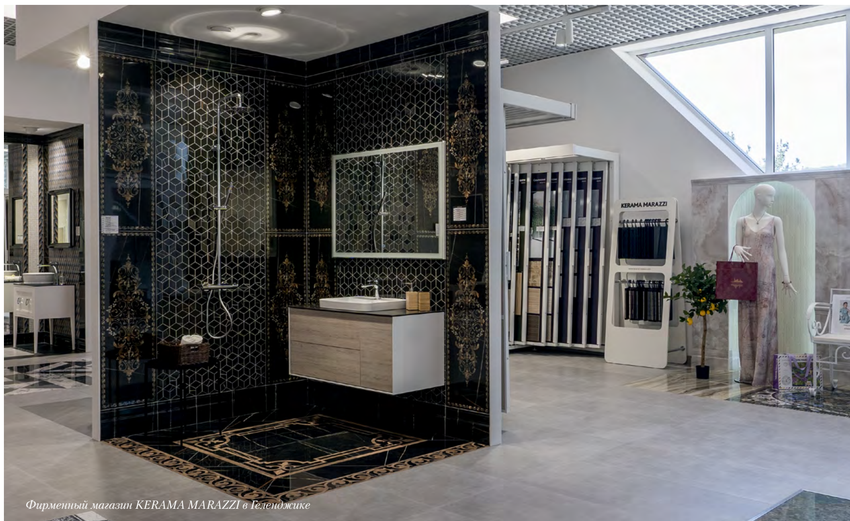
Фирменный магазин KERAMA MARAZZI в Геленджике

Один из самых больших плюсов фирменных магазинов KERAMA MARAZZI — возможность не просто купить плитку и мебель, но и увидеть завершённые варианты их применения. Каждое из таких решений демонстрирует разные грани, которыми в обстановке раскрываются керамические материалы.