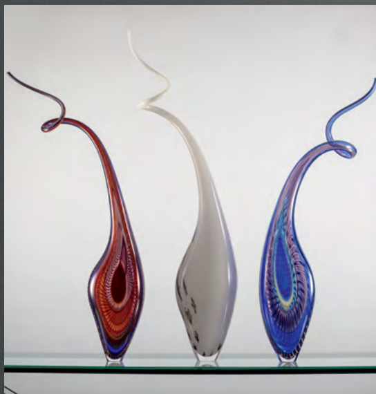
↑ Лино Тальяпьетра «Танец» (2016)