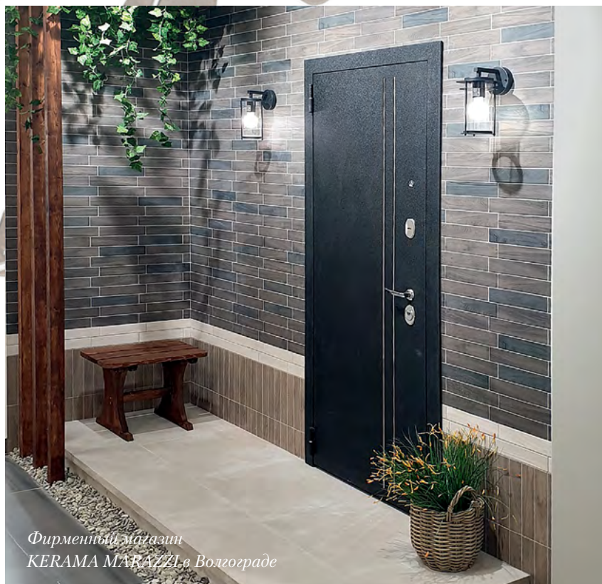
Фирменный магазин KERAMA MARAZZI в Волгограде