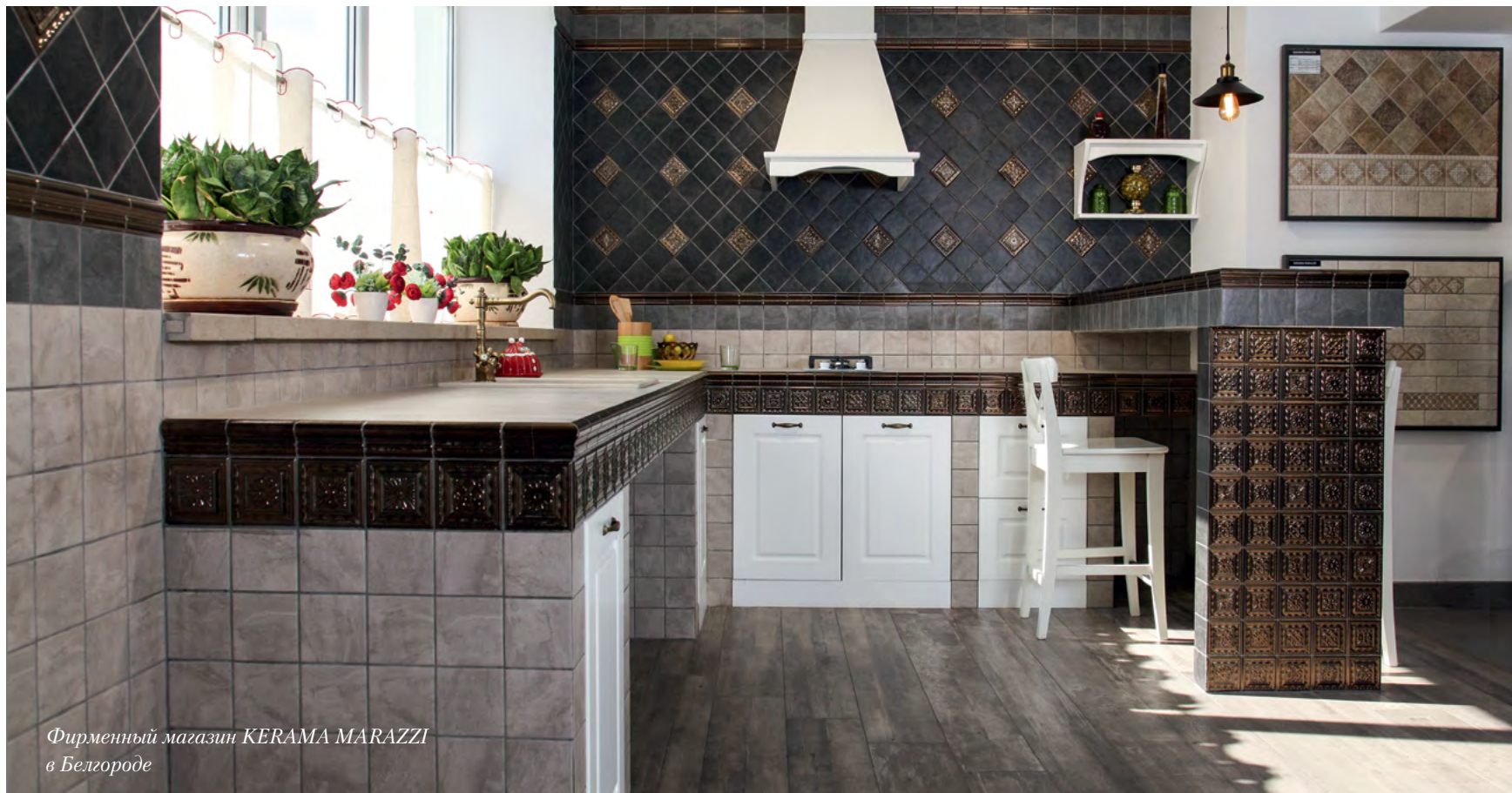
Фирменный магазин KERAMA MARAZZI в Белгороде