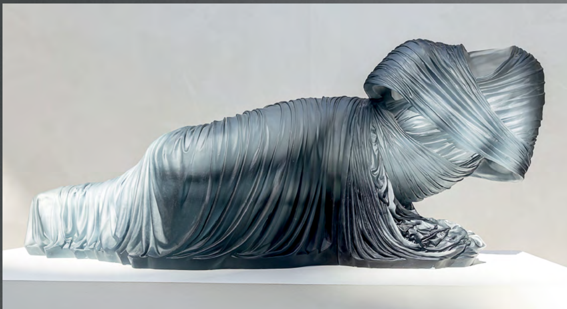
↑ Карен Ламонт «Полулежащий ноктюрн 4» (2018–2019)

Стеклянные платья, задрاپированные вокруг отсутствующих тел, — обнажённая натура наоборот. Чтобы добиться наибольшей пластичности, американская художница сначала создаёт платья из ткани, а затем мастера студии Venengo отливают их из тёмного стекла.