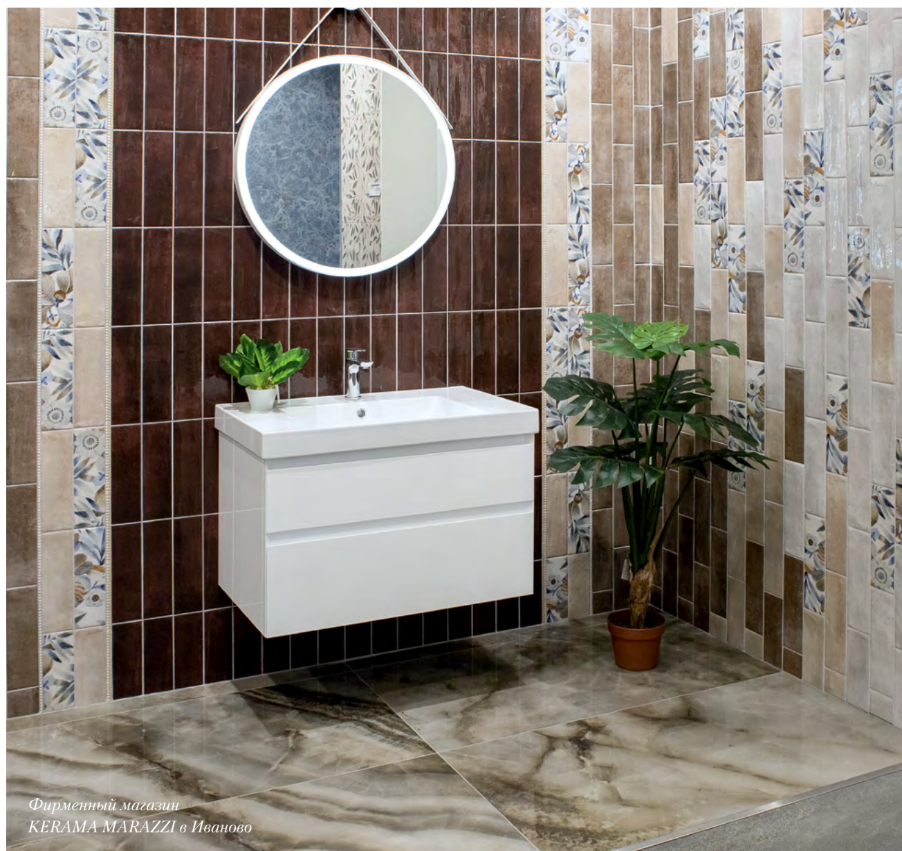
Фирменный магазин KERAMA MARAZZI в Иваново

На полу использован керамический гранит «Ониче». И рисунок, и серый дымчатый оттенок этого материала делают композицию более насыщенной. Внести в цветовое разнообразие белый контрапункт помогают мебель и сантехника из коллекции Geometrica: раковина CUBO, белая строгая тумба шириной 80 см, а также круглое зеркало.