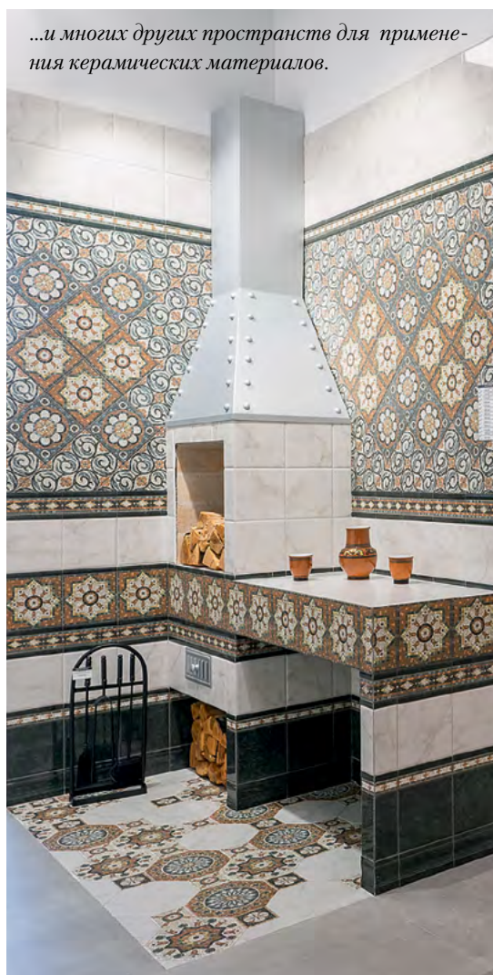
...и многих других пространств для применения керамических материалов.