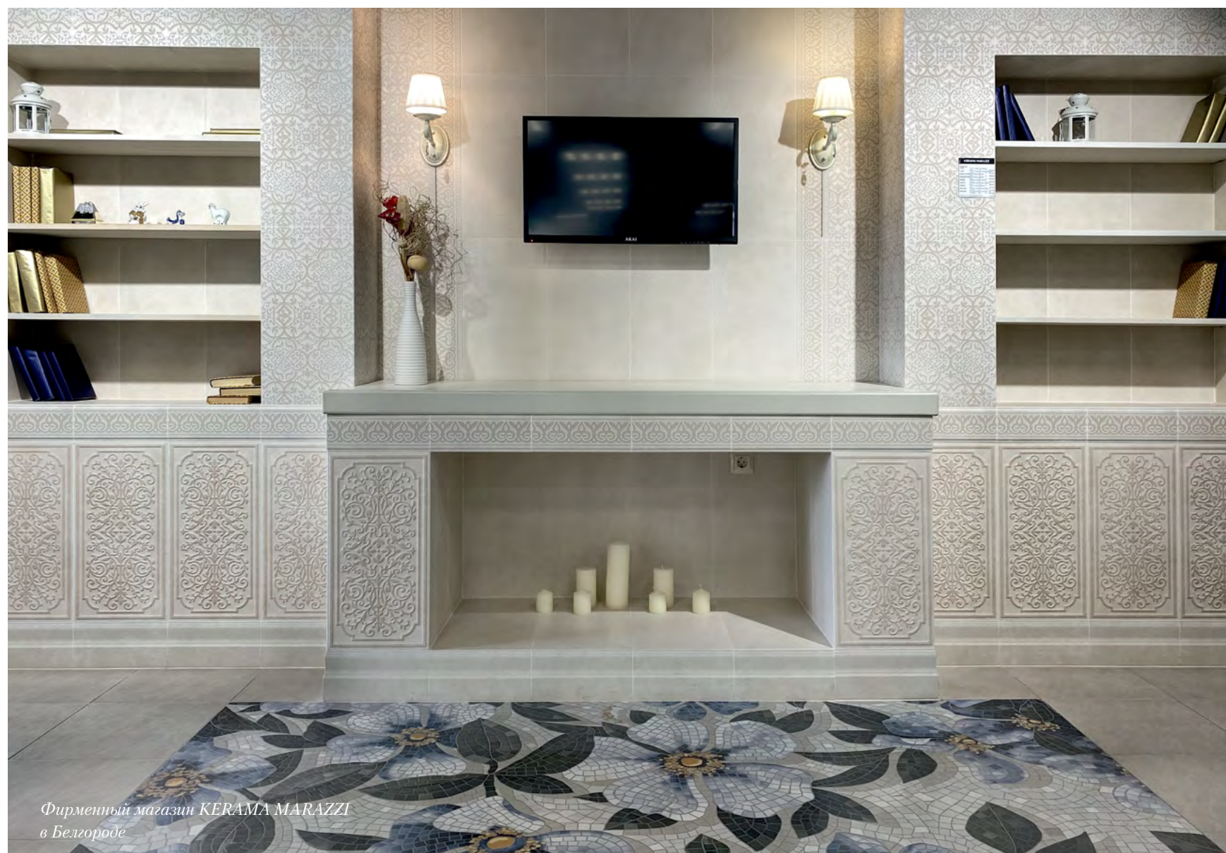
Фирменный магазин KERAMA MARAZZI в Белгороде