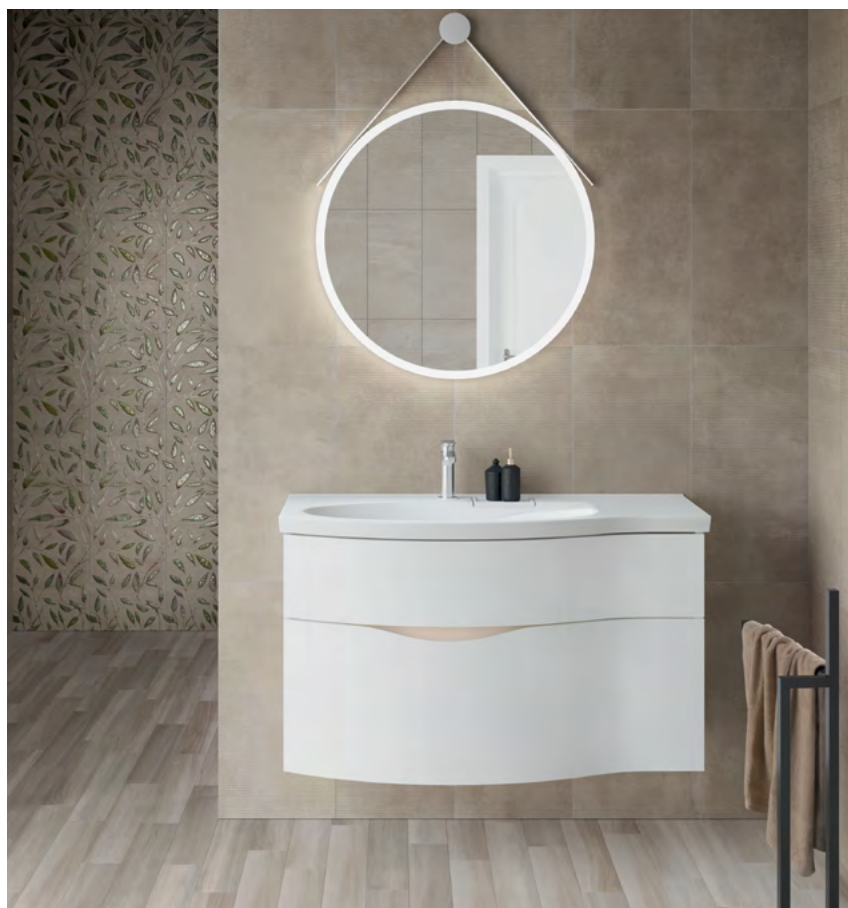
Раковина Riva 100 см, левое расположение чаши Тумба Riva 100 см, белая матовая Зеркало CONO круглое, 70 см Стена: плитка и декоры «Гинардо», формат 30 × 60 Пол: керамический гранит «Селект Вуд», формат 9,6 × 60