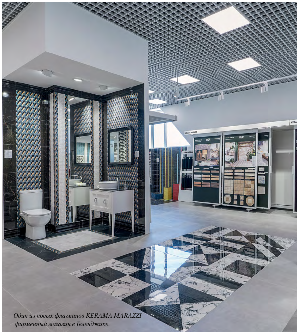
Один из новых флагманов KERAMA MARAZZI — фирменный магазин в Геленджике.

Пространство фирменных магазинов позволяет организовать для дизайнеров отдельную рабочую зону: сюда для выбора керамических