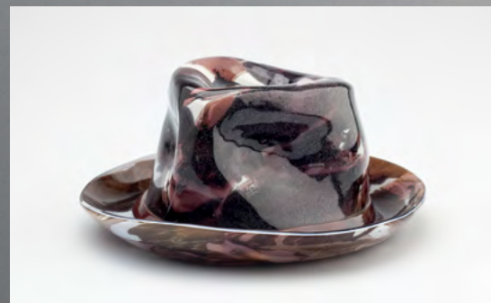
↑ Полли Апфельбаум «Снимаю перед вами шляпу» (2013)

Благодаря стеклу повседневное переходит в плоскость монументального. При этом в объектах сохраняется переменчивость: в складках шляпы каждый увидит своё отражение, и объект всякий раз будет представлять перед зрителем в новом свете.