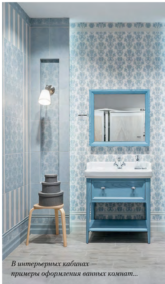
В интерьерных кабинках — примеры оформления ванных комнат...

В фирменных магазинах мы проводим для дизайнеров презентации новых коллекций, деловые завтраки и семинары, посвящённые, в том числе, техническим аспектам — например, истираемости керамогранита. Конечно, нам важно, чтобы наша аудитория лучше разбиралась в профессиональных продуктах. При этом не менее ценно — зарядить слушателей правильными эмоциями и энергией бренда: в этом очень помогает атмосфера наших магазинов. Сюда хочется возвращаться, а что может быть лучшей основой для сотрудничества!