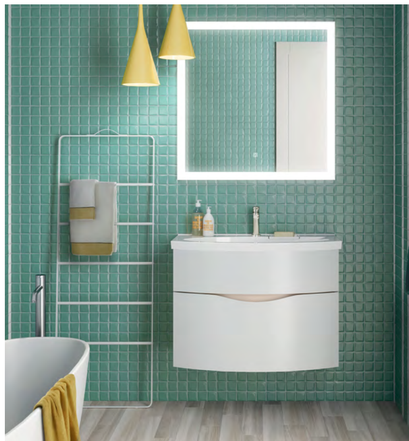
Раковина Riva 80 см Тумба Riva 80 см, белая глянцевая Зеркало с LED-подсветкой, 80 × 80 см Стена: мозаика «Анвер», формат 30 × 30 Пол: керамический гранит «Селект Вуд», формат 9,6 × 60