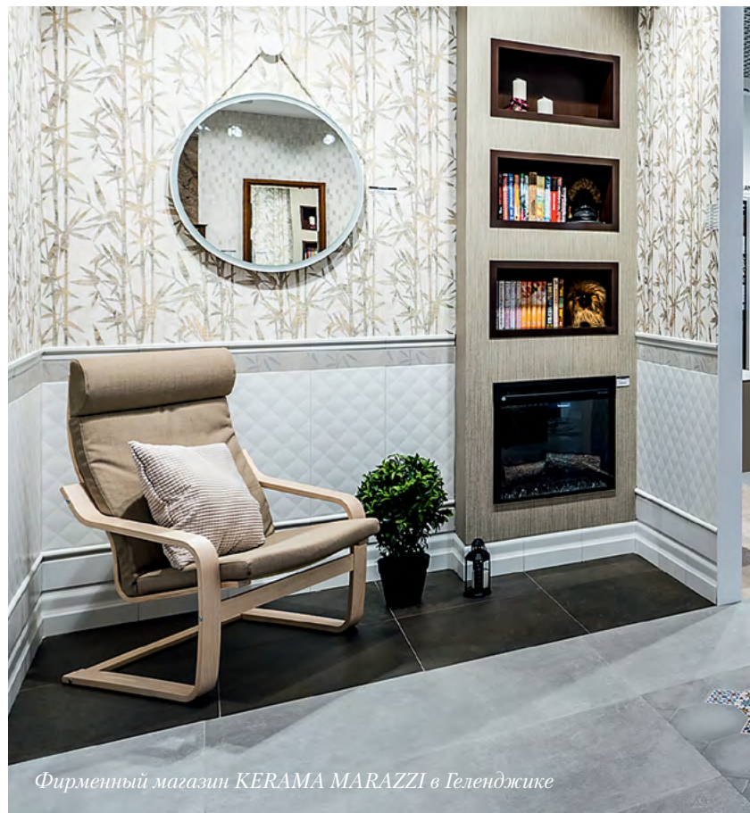
Фирменный магазин KERAMA MARAZZI в Геленджике